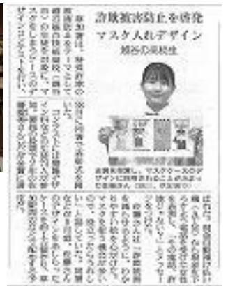
読売新聞 他8社掲載