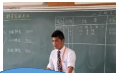
1年「簿記」授業の様子

今後は、お世話になった先生方への感謝の気持ちを忘れず教員になることを目指し、いつか越総に戻り、教鞭をとることを目標にして、日々精進してまいります。