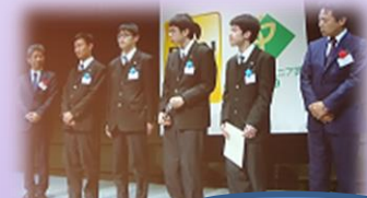
OBCN ITジュニア賞授賞式