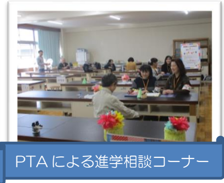
PTAによる進学相談コーナー