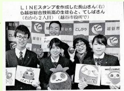
LINEスタンプを作成した長山さん(右)ら越谷総合技術高の生徒らと、てしばさん(右から2人目)(越谷市役所で)

地元のスタンダードベーカリーのご協力を得て、「まんまる豆腐パン」を考案、販売しました。